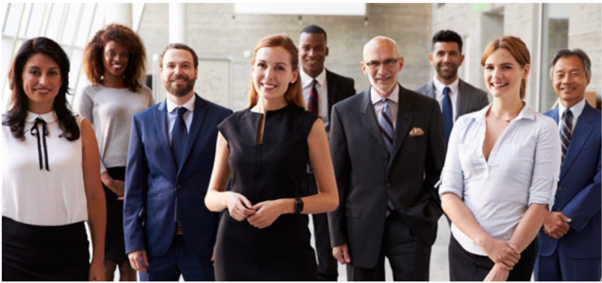
Programme de formation